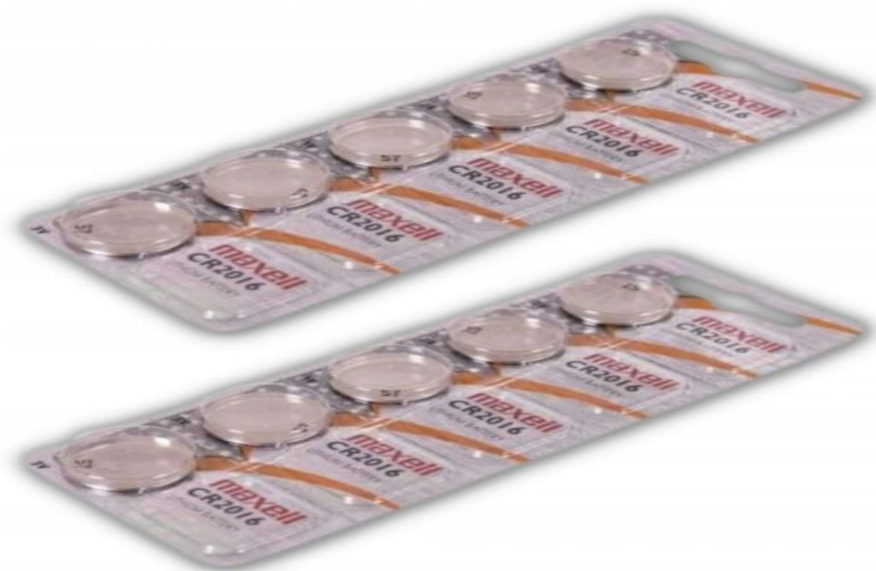
Baterie Maxell CR2016 3,0V Lithium (5 sztuk) blister x 2 opakowania